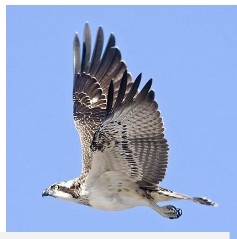
Fiskgjuse, Mälarhusen, 2 september