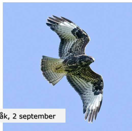
Ormvråk, 2 september