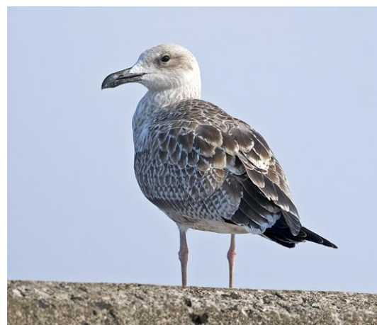
Kaspisk trut, Simrishamns hamn, 3 september