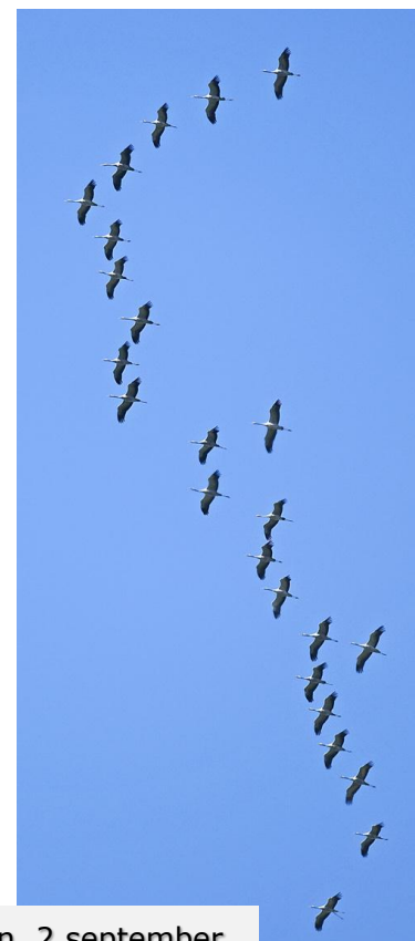
Tranor, Fyledalen, 2 september