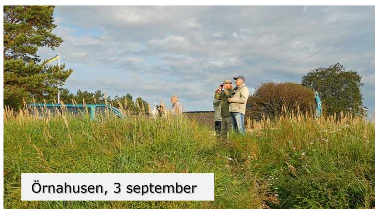
Örnahusen, 3 september