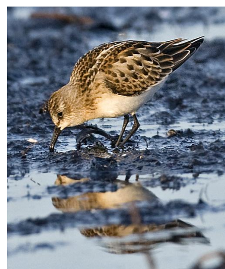
Småsnäppa, Risteören, 3 september