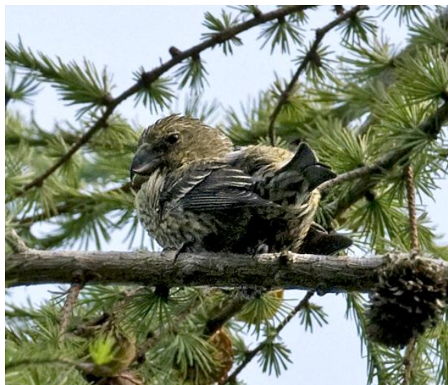
Bändelkorsnäbb, Mexikovägen, 3 september