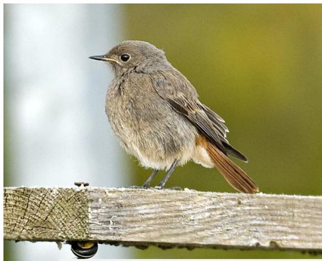
Svart rödstjärt, Skillinge, 3 september