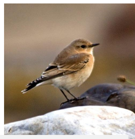
Stenskvätta, Brantevik, 1 september