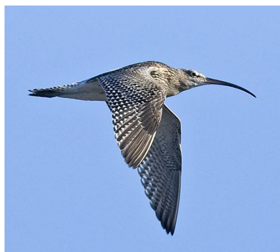
Storspov, Mälarhusen, 2 september