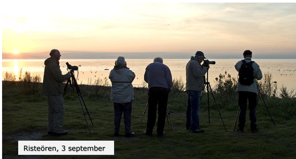
Risteören, 3 september