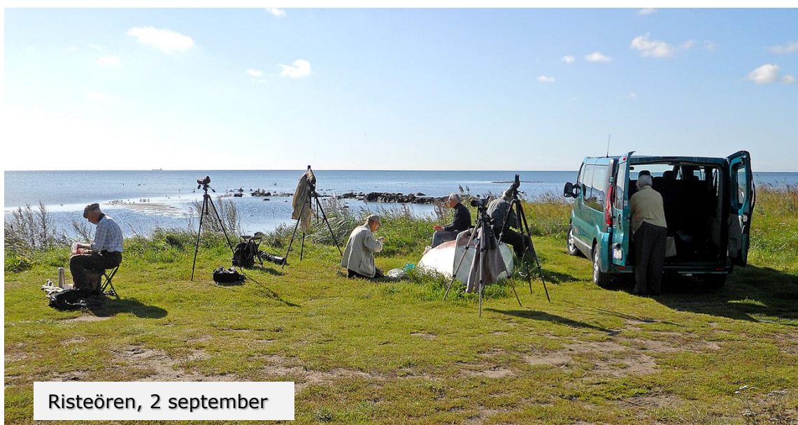
Risteören, 2 september

Omslag: Skrattnåsar, Risteören, 3 september