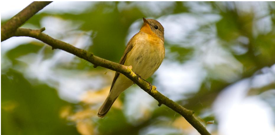
Mindre flugsnappare, Gislöv Stjärna 18 maj.