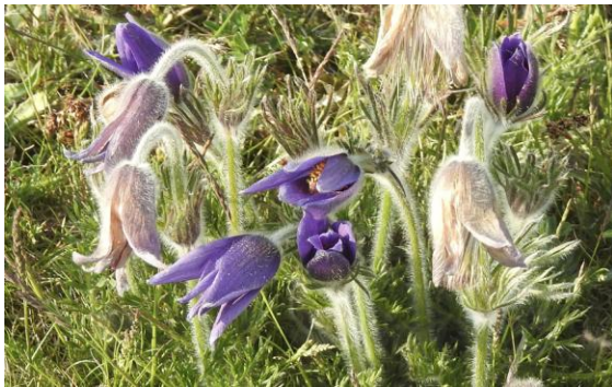
Backsippa, Grönet 15 maj.

Backsipporna har passerat zenit men några fina exemplar finns ändå kvar.