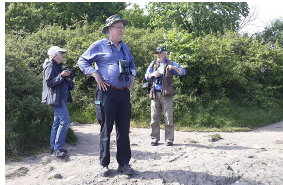
Mest vacker utsikt från toppen av Stenshuvud. Men det finns alltid någon svarthätta/trädgårdssångare man kan träna på.

som ropar en lång stund från en enbusktopp. Fältpiplärka har varit säker på Heden i årtal men detta år verkar det inte finnas någon på plats. Förutom göktyta kan vi dock glädjas åt gröngöling och spillkråka.