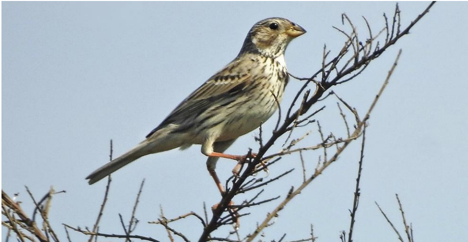
Riktigt exklusiv: kornsparv vid Peppinge 17 maj.