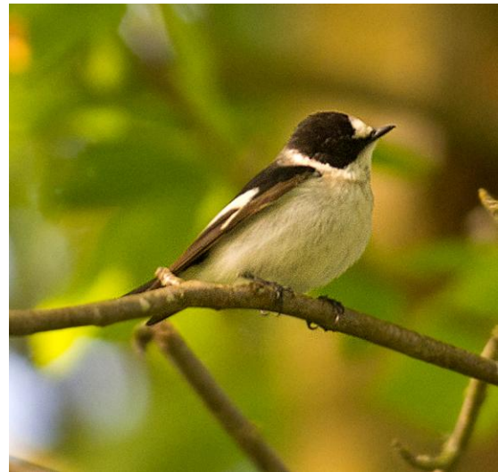
Halsbandsflugsnappare, Österlengymnasiet 18 maj.

En ovanligt händelserik dag! Som börjar med ett lokallarm strax innan vi ska ge oss av 0745: sjungande mindre flugsnappare i Gislövs Stjärna. Det tar oss knappt 15 minuter att åka dit och snart står vi under den sjungande fågeln – en vackert röd adult hanne dessutom. Vilken knallstart på dagen – det kan knappast toppas. Tror vi.