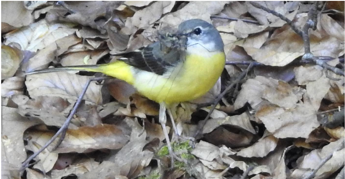
Forsärla, honan. Forsemölla 20 maj.