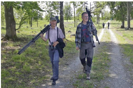
Ingen härfågel i Maglehem. Men rätt nöjda ändå.

Här tipsas vi av en kille från Länsstyrelsen som just kommer från Maglehems naturreservat där han sett en härfågel (som dessutom ska ha funnits i området några dagar enligt lantbrukaren på platsen). Hastigt och lustigt ändrar vi våra planer och går en trevlig runda träffar till och med sagda lantbrukare som kan bekräfta att vi är på rätt plats. Någon härfågel ser vi dock inte men kan njuta av trädlärkans vackra sång. Dubbeltrast och buskskvätta är dessutom nya arter för oss.