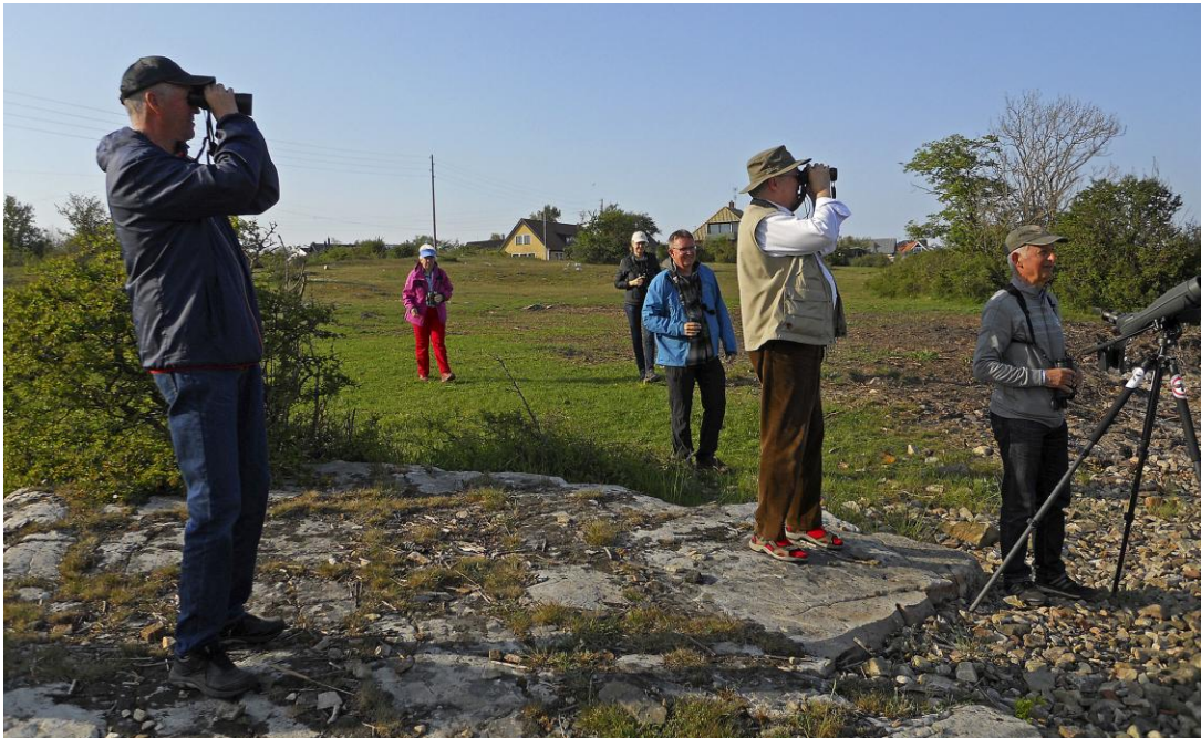
Fint kvällspan vid Grönet den 15 maj.