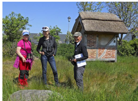
Inga humlepälsbin hemma vid Branteviks bihotell.

Därefter samling vid Hamnkiosken i Simrishamn för avslutande glass och en sista artgenomgång.