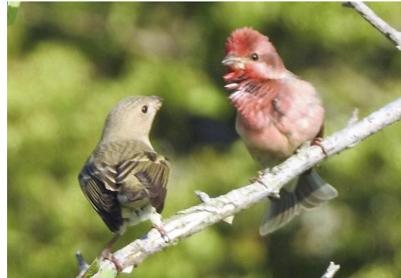
Rosenfinkpar, Simris strandäng 16 maj.

Vi går ut i de mer öppna markerna i södra delarna av Glimminge hallar där vi hör en avlägsen sommargylling bort mot Lilla Stjärnan. Programmenligt hör vi också ett par klockrodor i stenbrottsdammen och ser till slut ett ex.