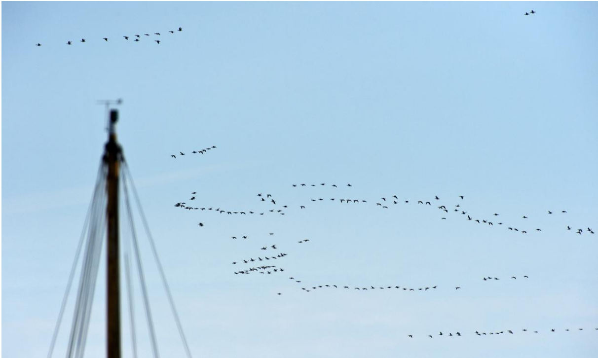
27.800 vitkindade gäss förbi Skillinge på 15 minuter den 16 maj. Sanslöst! 187 ex. på bilden.