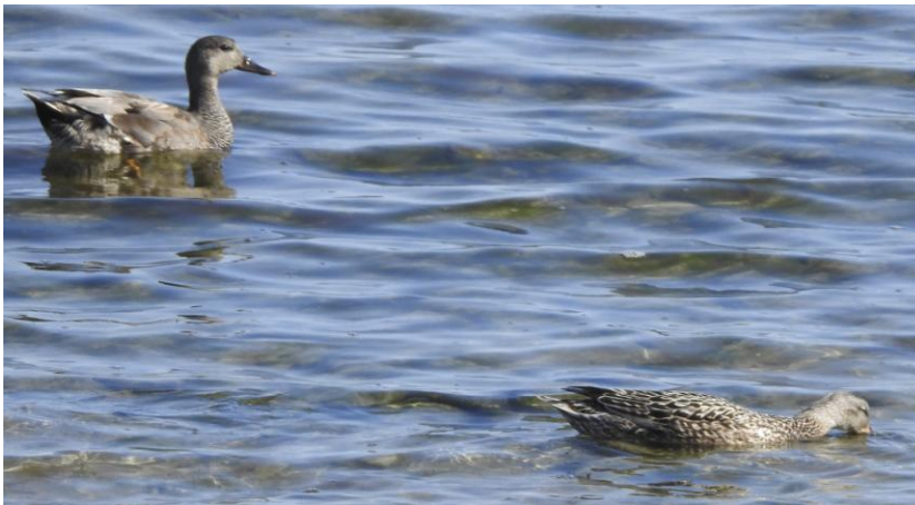
Snatterandspar, Skillinge södra 19 maj.