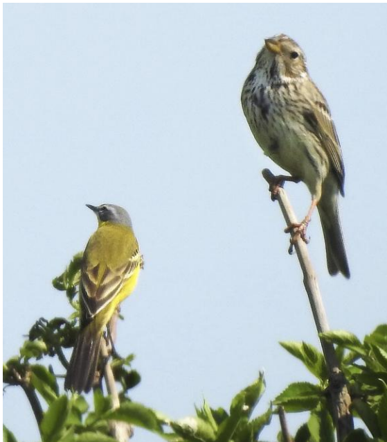
Gulärta och kornsparv, Peppinge 17 maj. Fotografen i extas.