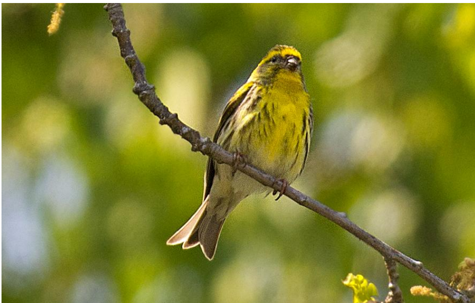
En gulhämpling sjöng för oss vid Björket.