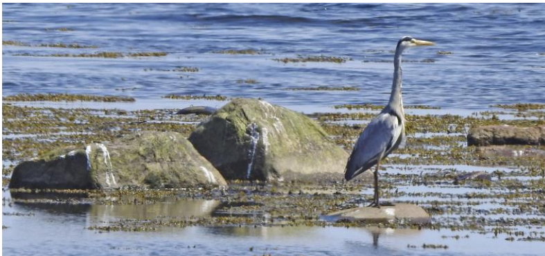
Stolt gråhäger vid Morfarshamn 16 maj.