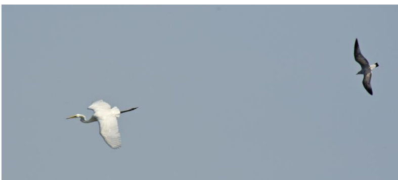
Ågretthäger mobbad av fiskmås. Varför undrar vi. Gislövshammar 17 maj.