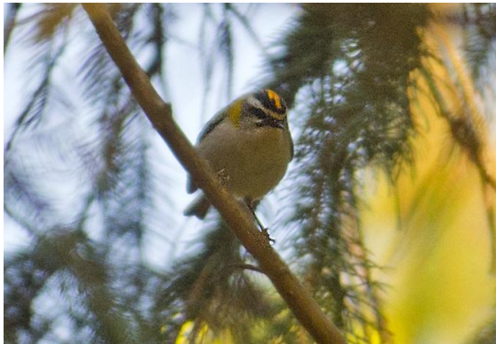
Brandkronad kungsfågel i granplantering, Bräknyrd.

Ravlunda skjutfält är tyvärr stängt denna vecka så vi får hitta på alternativlokaler. Och kör därför till Drakamöllan för andra frukost och avlyssning av sommargylling. Som vi hör några gånger men kanske inte helt tillfredsställande på grund av att förmiddagen hunnit bli rätt sen – vi har ju haft en del bonusaktiviteter för oss. Ännu roligare är kanske en spelflygande bivråk inklusive vingklatsch – något man sannerligen inte ser varje dag.