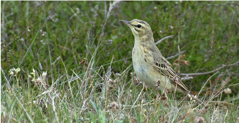
Fältpiplärka, Drakamöllan 19 maj.