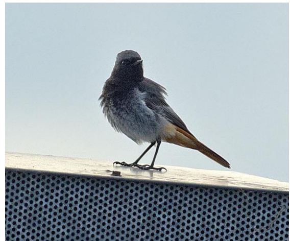
Svart röstjärt, snygg hanne. Simrishamns hamn.

Efter fika i Simrishamn stannar vi till vid Revet. Bara de vanliga måsfågelarterna men en svarta och drygt tio kentska tärnor gläder.