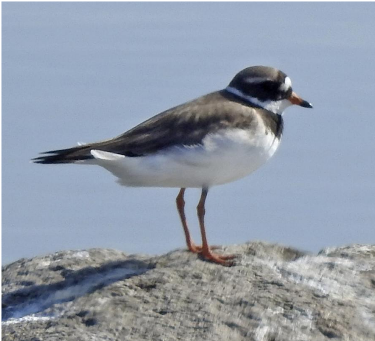
Inte många vadare under resan (för bra väder). Men vi såg i alla fall större strandpipare vid Gislövshammar 17 maj.