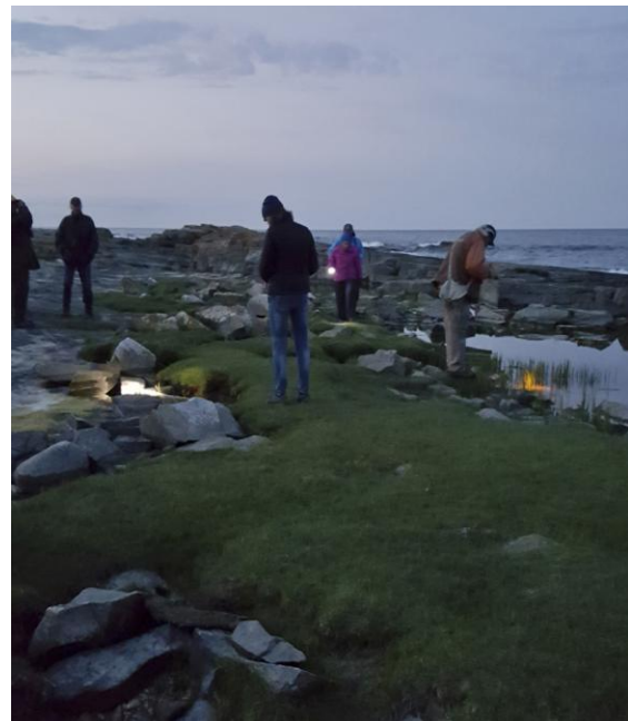
Paddjakt, Grönet 18 maj.

Därefter vidtar obligatorisk promenad upp till Södra och Östra huvudet. På vägen upp stannar vi under en sjungande grönsångare men kan inte riktigt enas om den är gul på bröstet eller inte. Väl uppe beundrar vi den himmelsvida utsikten, inte minst intagande i det vackra sommarväder vi fick även idag, dessutom med ovanligt klar sikt.