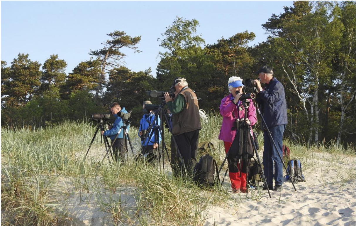
Flitig sträckspaning i arla morgonstund vid Tygeåns mynning 17 maj.