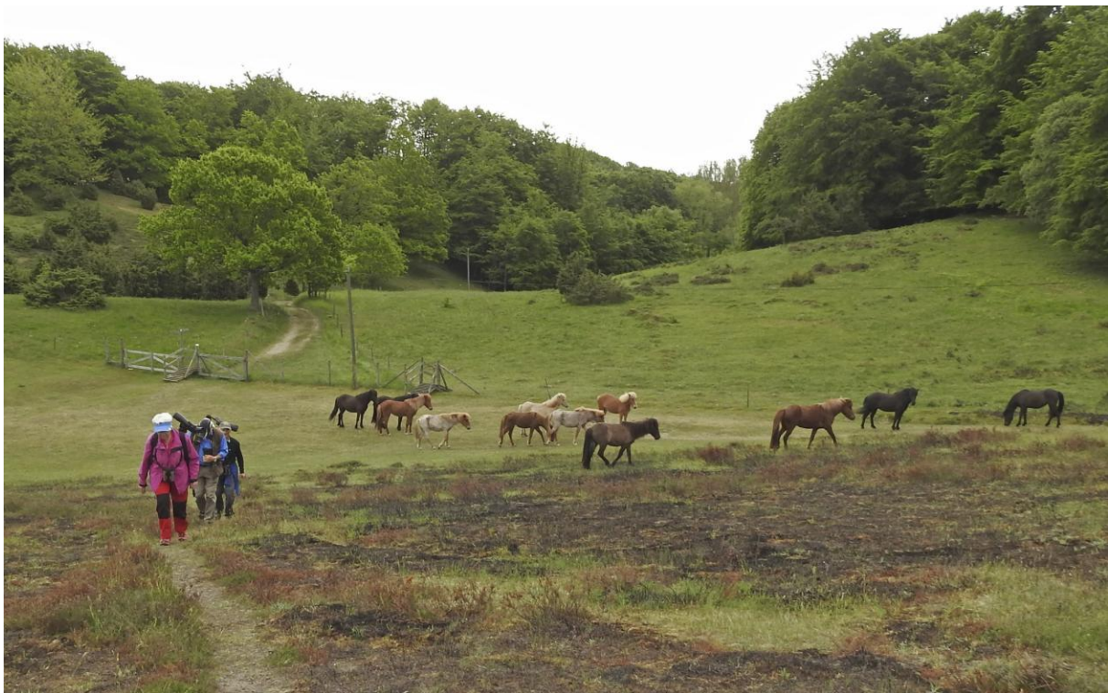
Mot fältpiplärkan. Drakamöllan 19 maj.

OMSLAG. Chockstart med rosenfink vid Simris strandäng första morgonen.