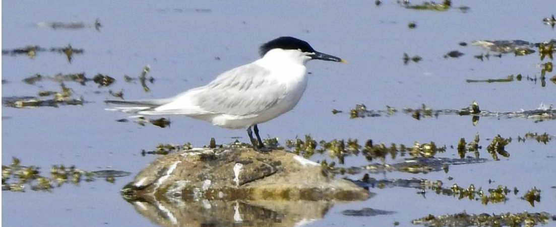
Kentsk tärna, Norra viken 16 maj.