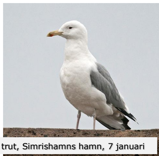
Kaspisk trut, Simrishamns hamn, 7 januari