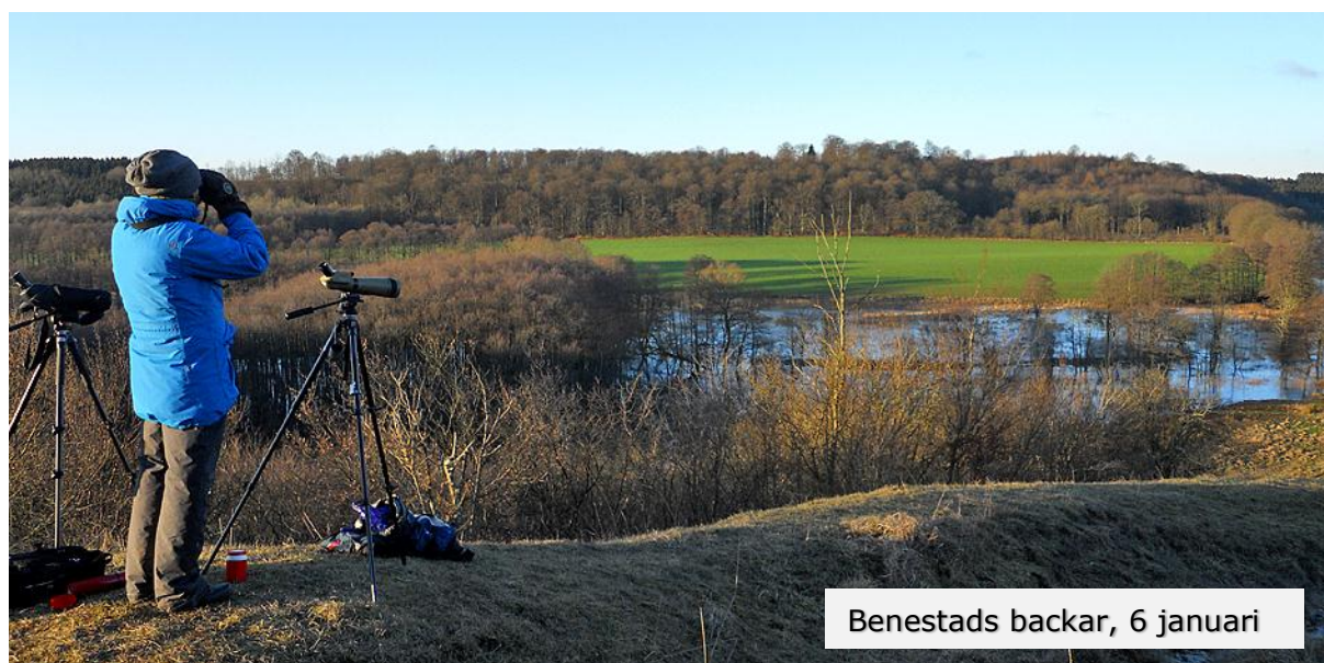
Benestads backar, 6 januari

Omslag: Bändelkorsnäbb, hanne, Stockholmsgården, 7 januari