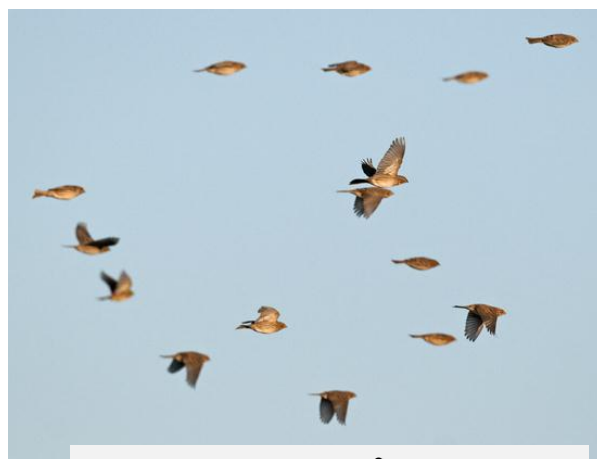
Kornsparvar, Alingsgård, 6 januari