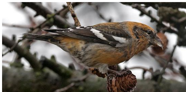
Bändelkorsnäbb, yngre hanne, Stockholmsgården, 7 januari