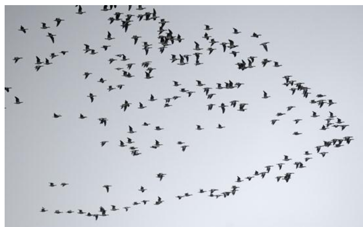
Vitkindade gäss, Torupa flo, 6 januari