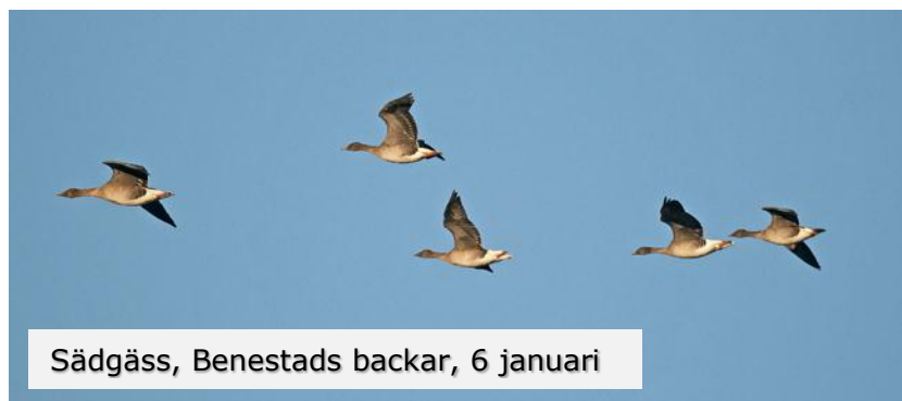
Sädgäss, Benestads backar, 6 januari