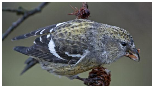
Bändelkorsnäbb, hona, Stockholmsgården, 7 januari