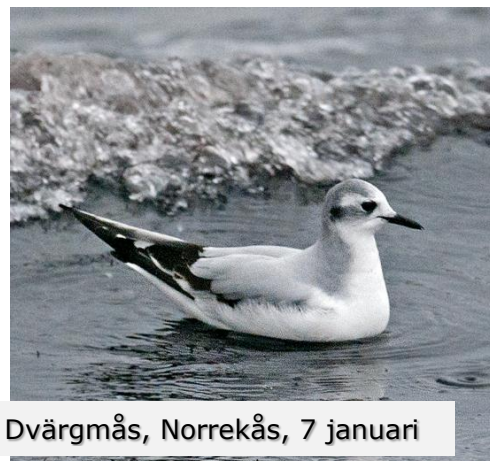
Dvärgmås, Norrekås, 7 januari