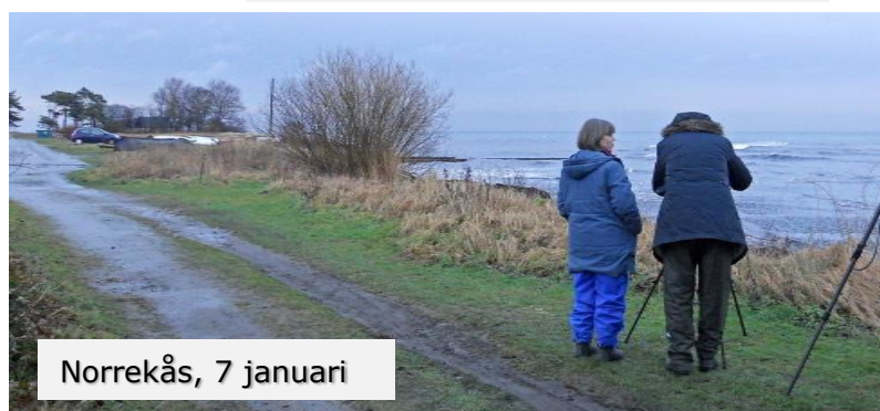
Norrekås, 7 januari