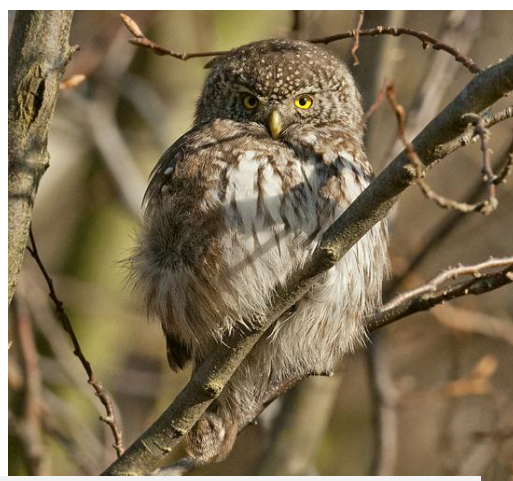
Sparvuggla, Tegelbruket, 6 januari