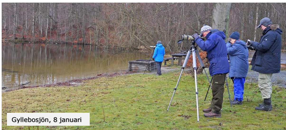
Gyllebosjön, 8 januari