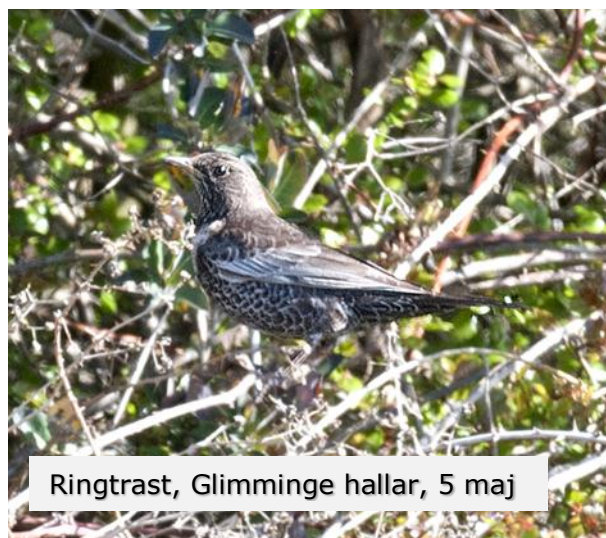
Ringtrast, Glimminge hallar, 5 maj