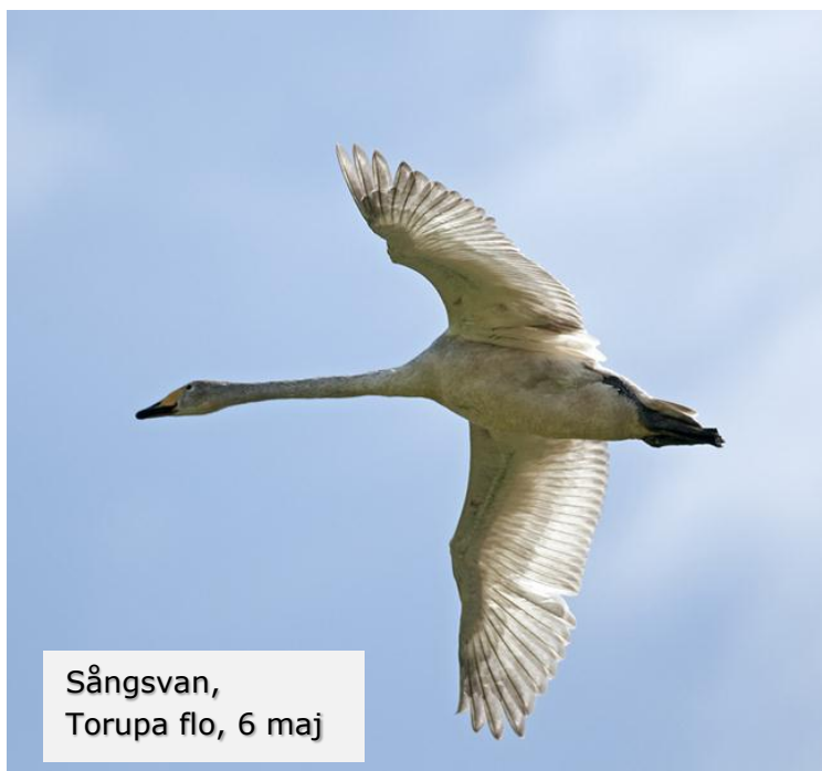
Sångsvan, Torupa flo, 6 maj