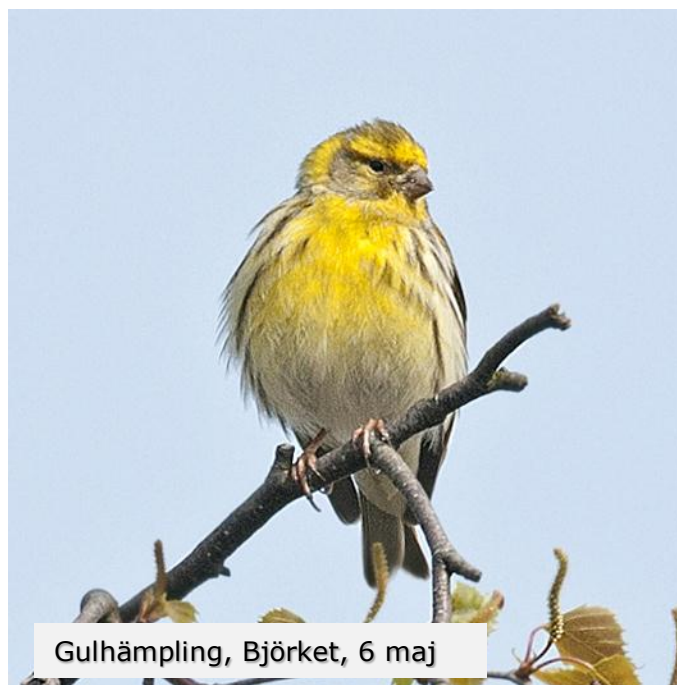
Gulhämling, Björket, 6 maj