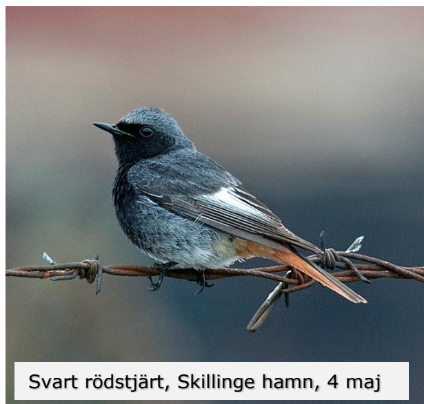
Svart rödstjärt, Skillinge hamn, 4 maj