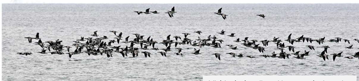
Vitkindade gäss, Hagestad, 4 maj