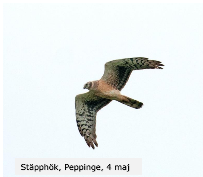
Stäpphök, Peppinge, 4 maj