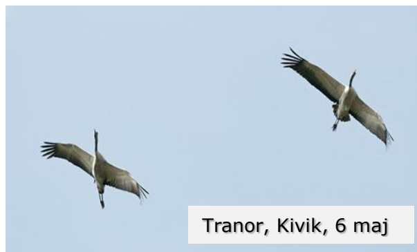
Tranor, Kivik, 6 maj