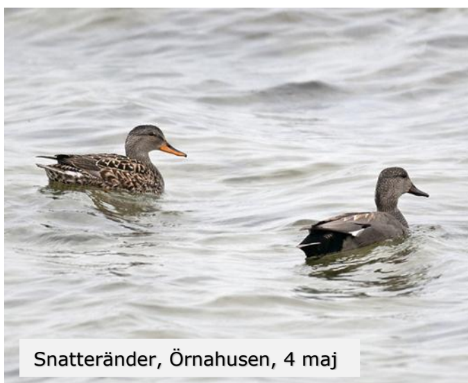
Snatteränder, Örnahusen, 4 maj