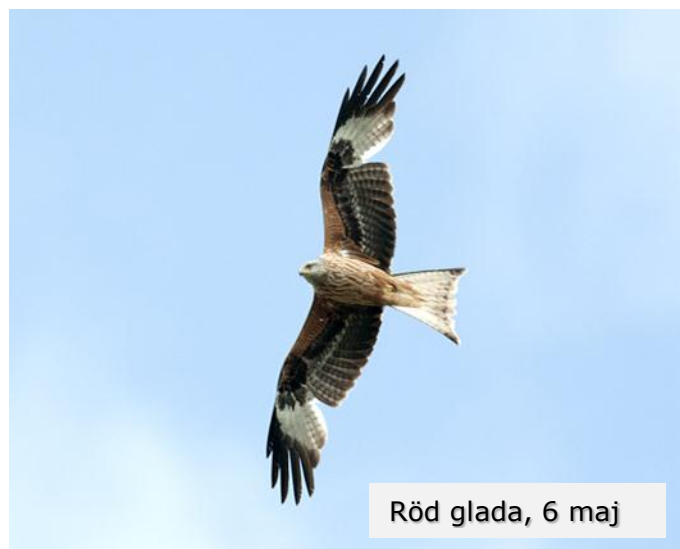
Röd glada, 6 maj