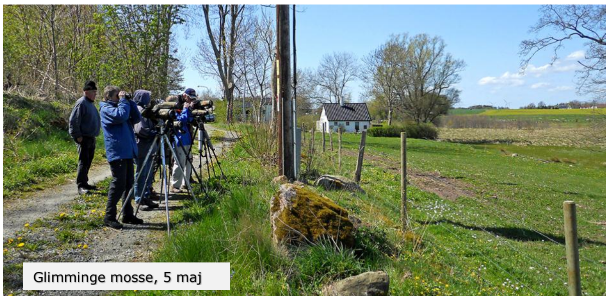
Glimminge mosse, 5 maj