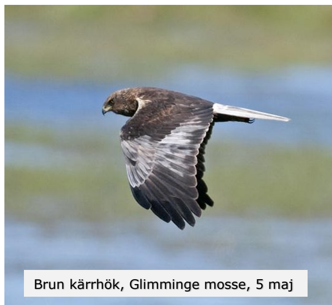
Brun kärrhök, Glimminge mosse, 5 maj